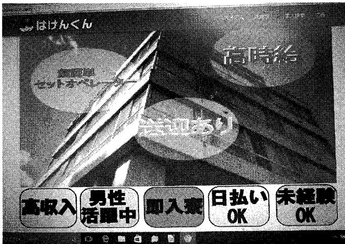
日輪の自社制作・運営サイト。女性向け求人「ジョブ派遣WOMAN」（上）と工場系求人「はけんくん」の画面

更新して鮮度維持を心掛けるとともに、コンテンツのグレードアップも常時進めている。